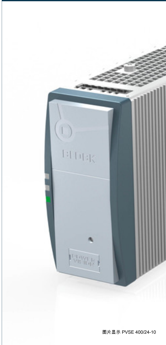
图片显示 PVSE 400/24-10