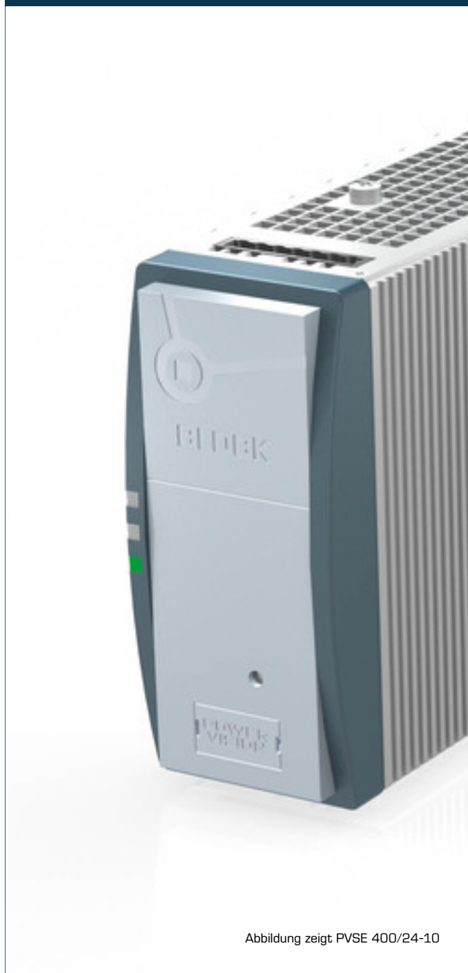
Abbildung zeigt PVSE 400/24-10