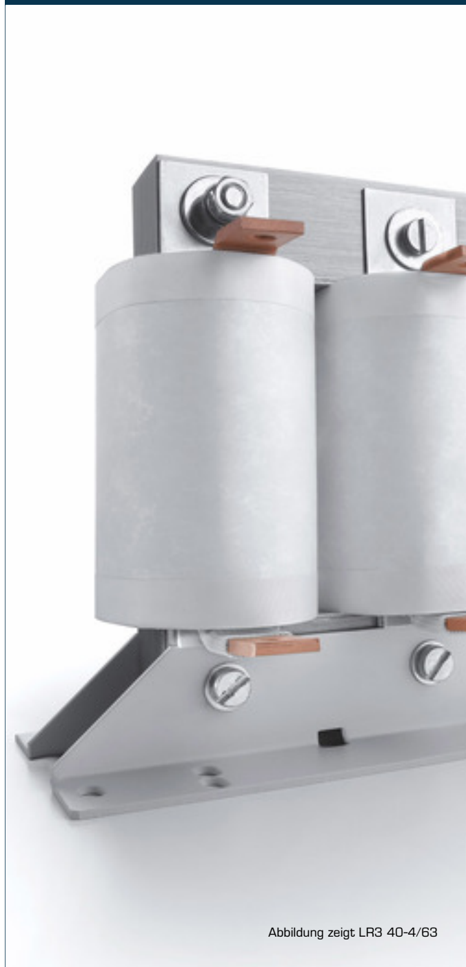
Abbildung zeigt LR3 40-4/63