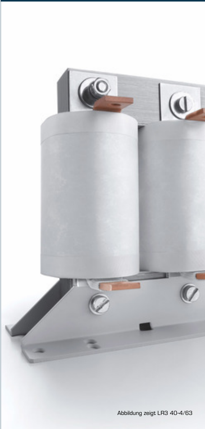
Abbildung zeigt LR3 40-4/63