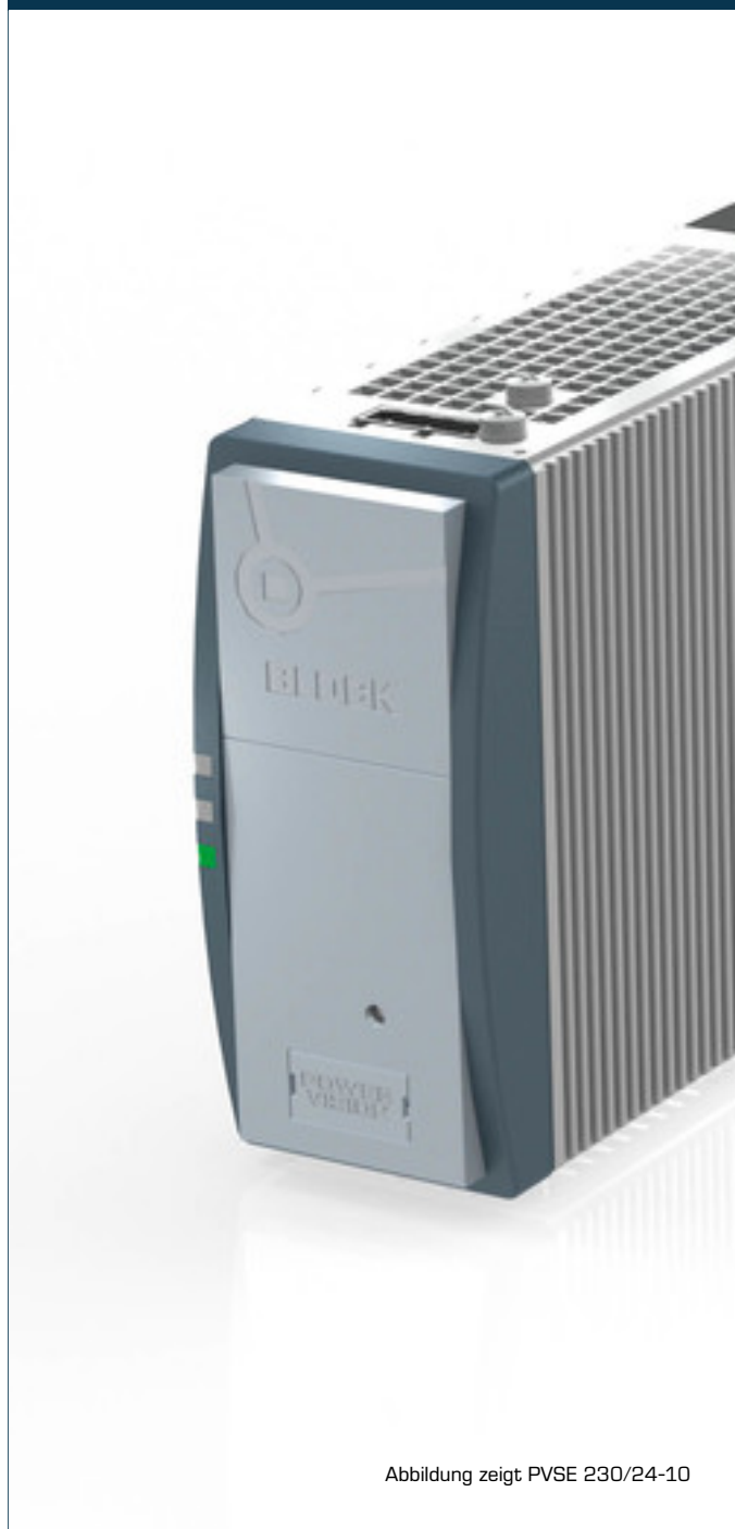
Abbildung zeigt PVSE 230/24-10