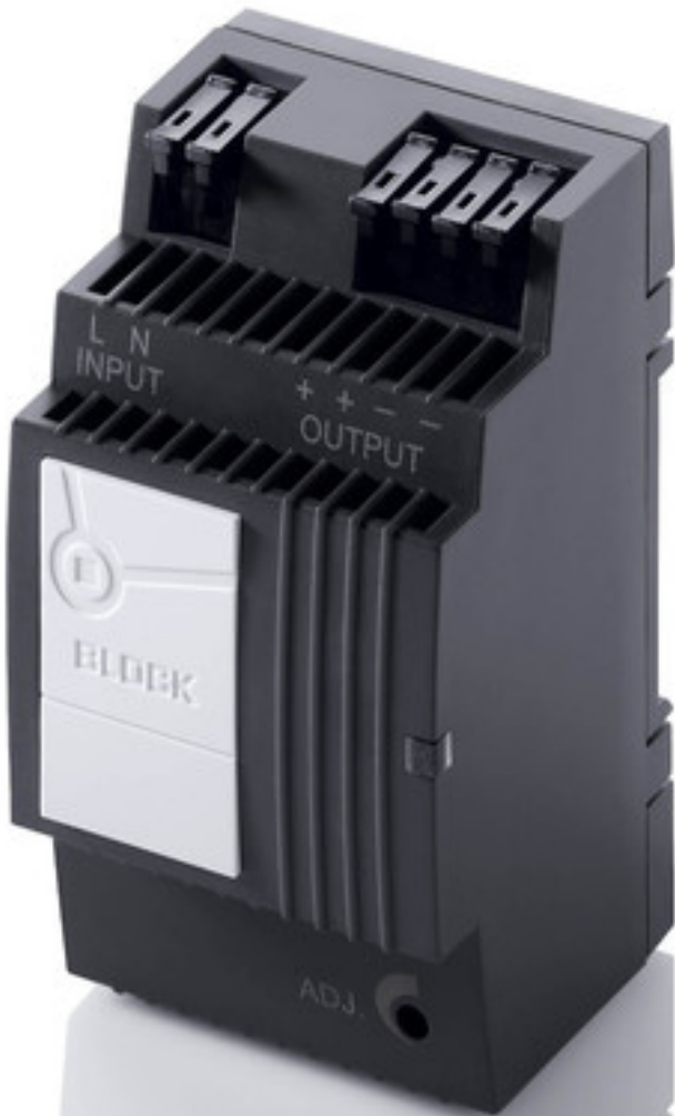
Abbildung zeigt PEL 230/24/1,3