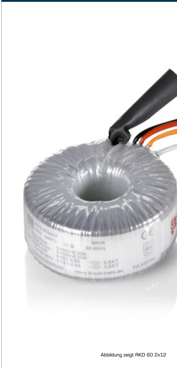
Abbildung zeigt RKD 60 2x12