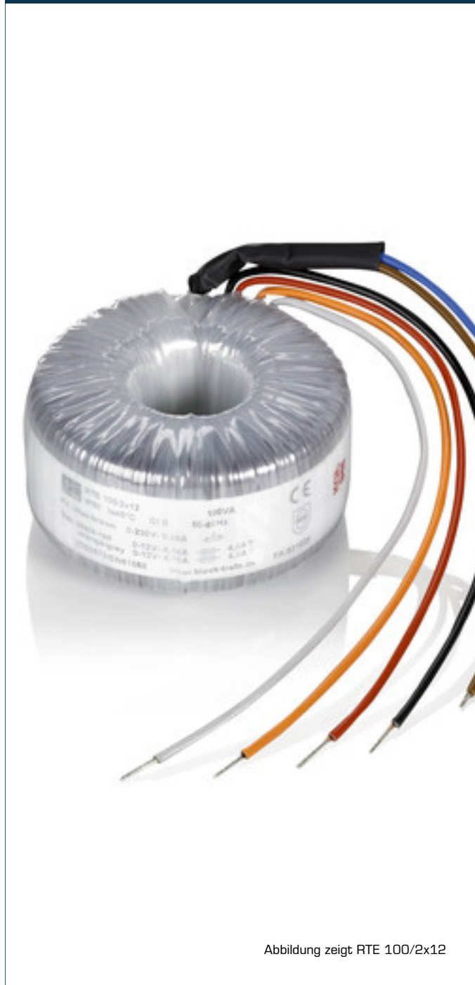
Abbildung zeigt RTE 100/2x12