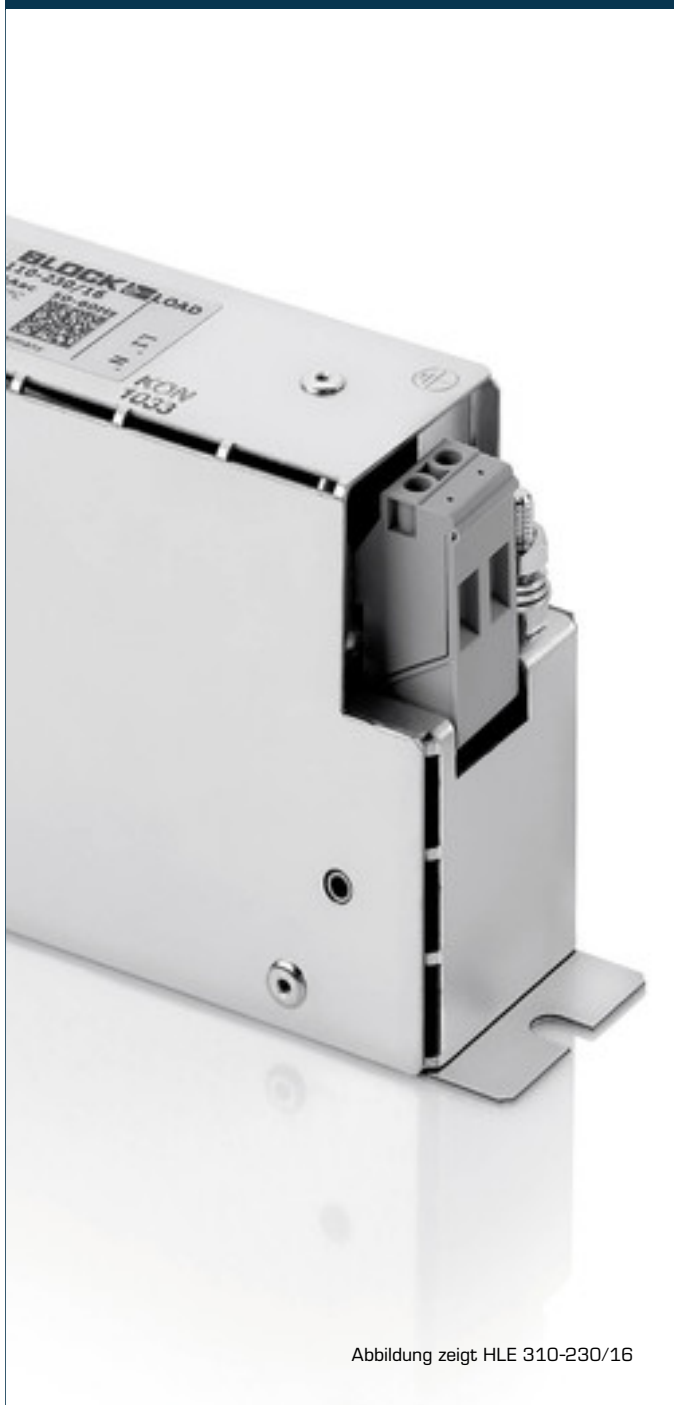
Abbildung zeigt HLE 310-230/16