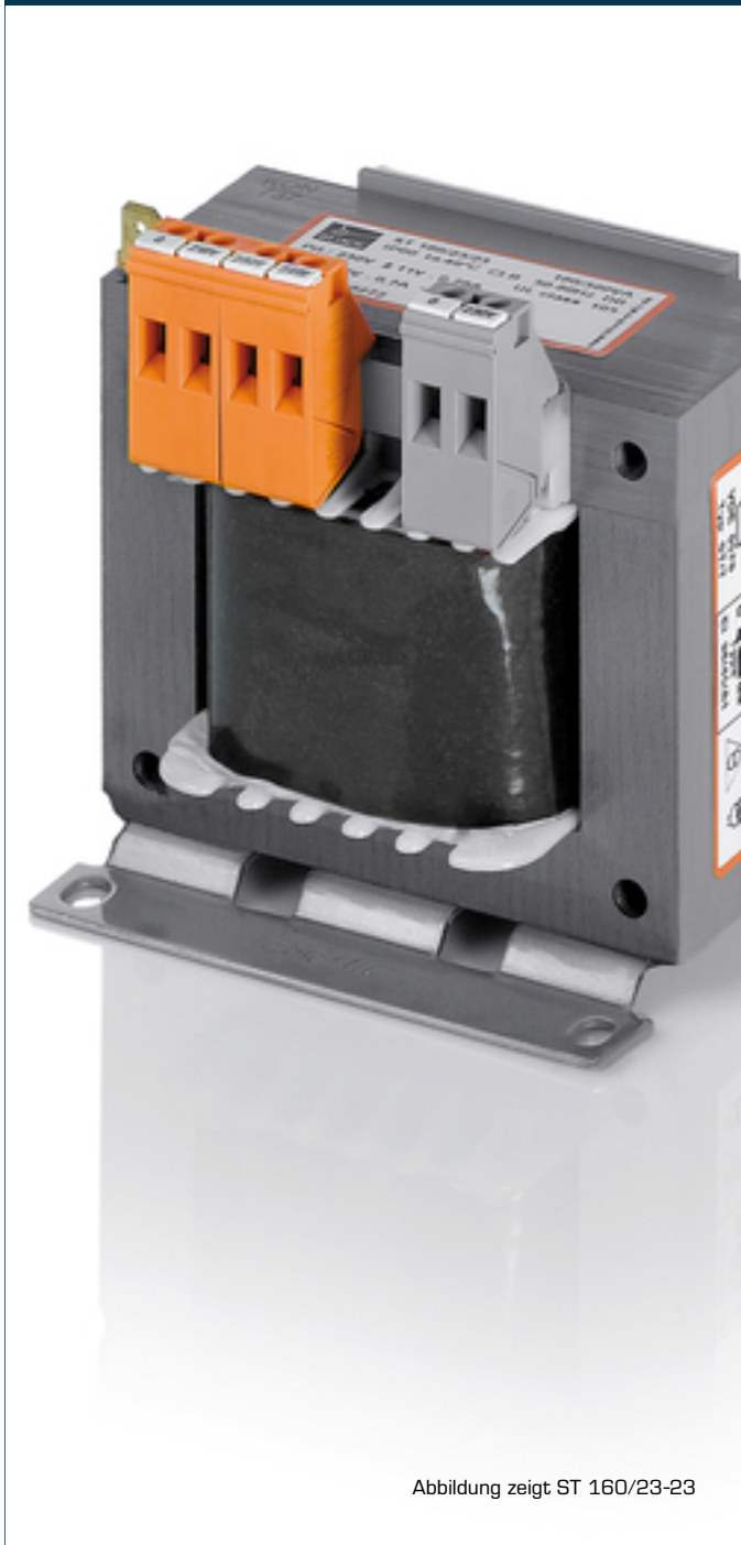
Abbildung zeigt ST 160/23-23