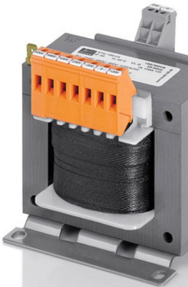
Abbildung zeigt STU 160/24