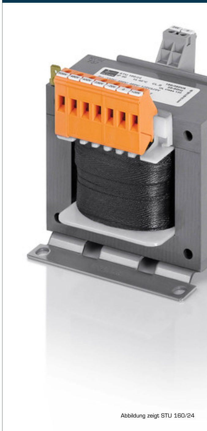
Abbildung zeigt STU 160/24