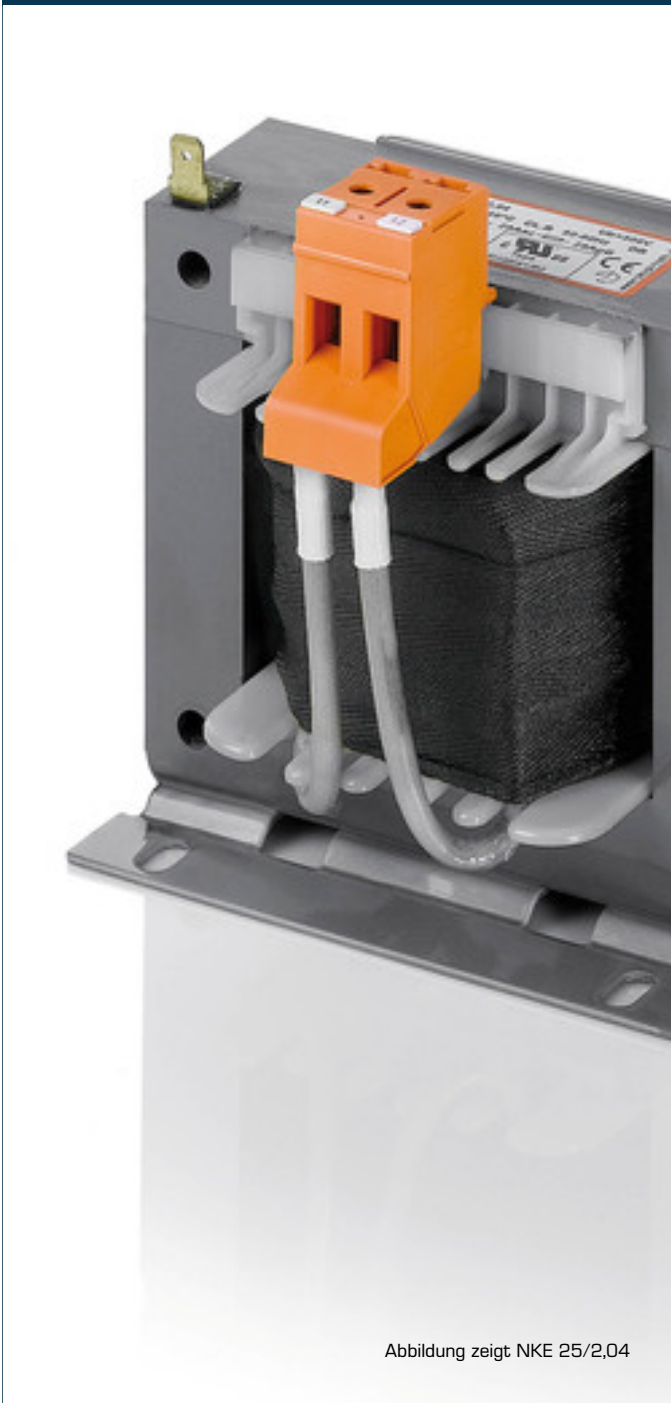
Abbildung zeigt NKE 25/2,04