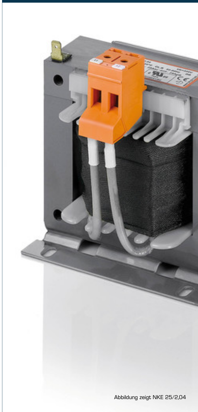
Abbildung zeigt NKE 25/2,04