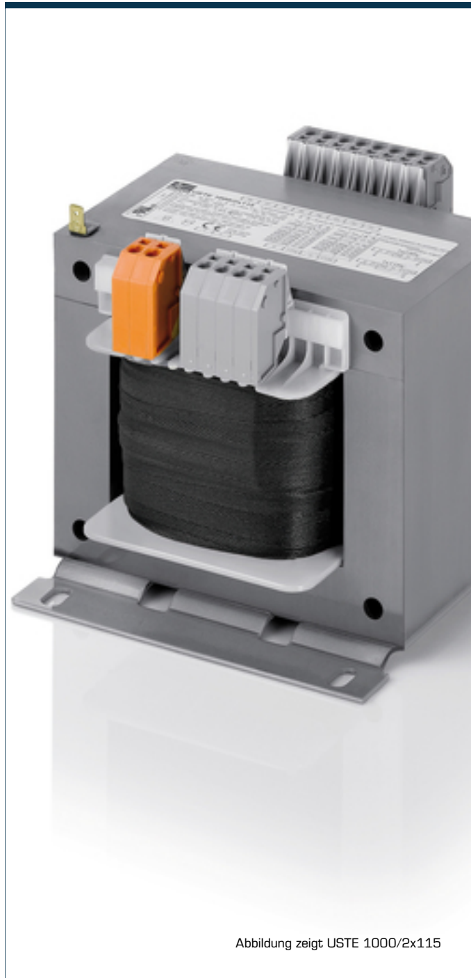
Abbildung zeigt USTE 1000/2x115