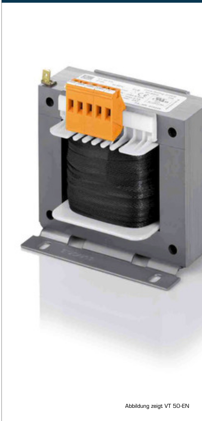
Abbildung zeigt VT 50-EN