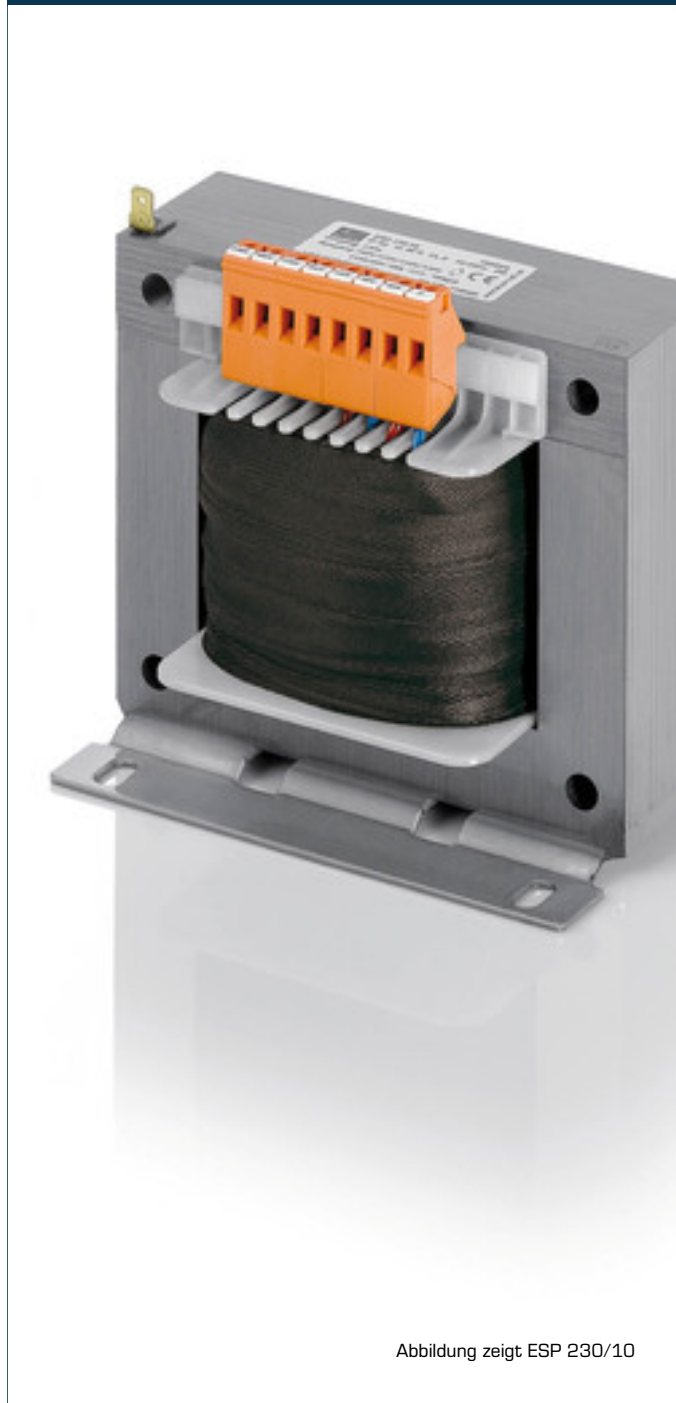
Abbildung zeigt ESP 230/10