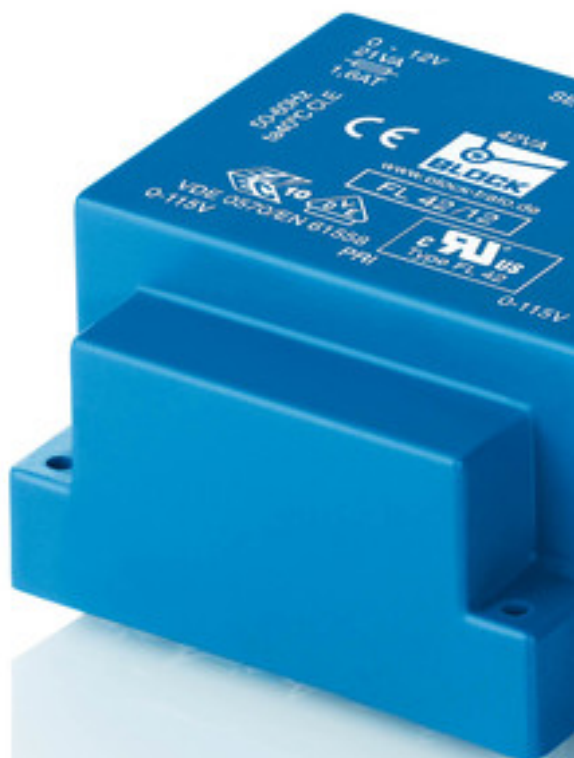
Abbildung zeigt FL 42/12