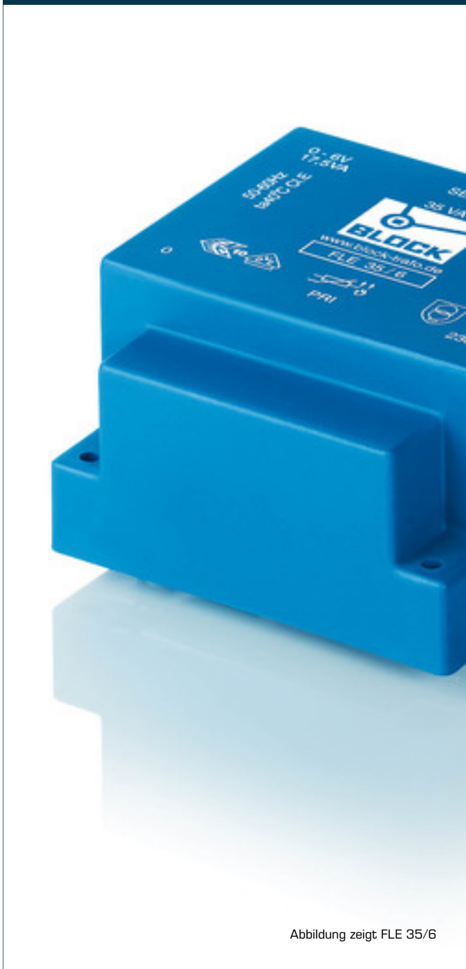
Abbildung zeigt FLE 35/6