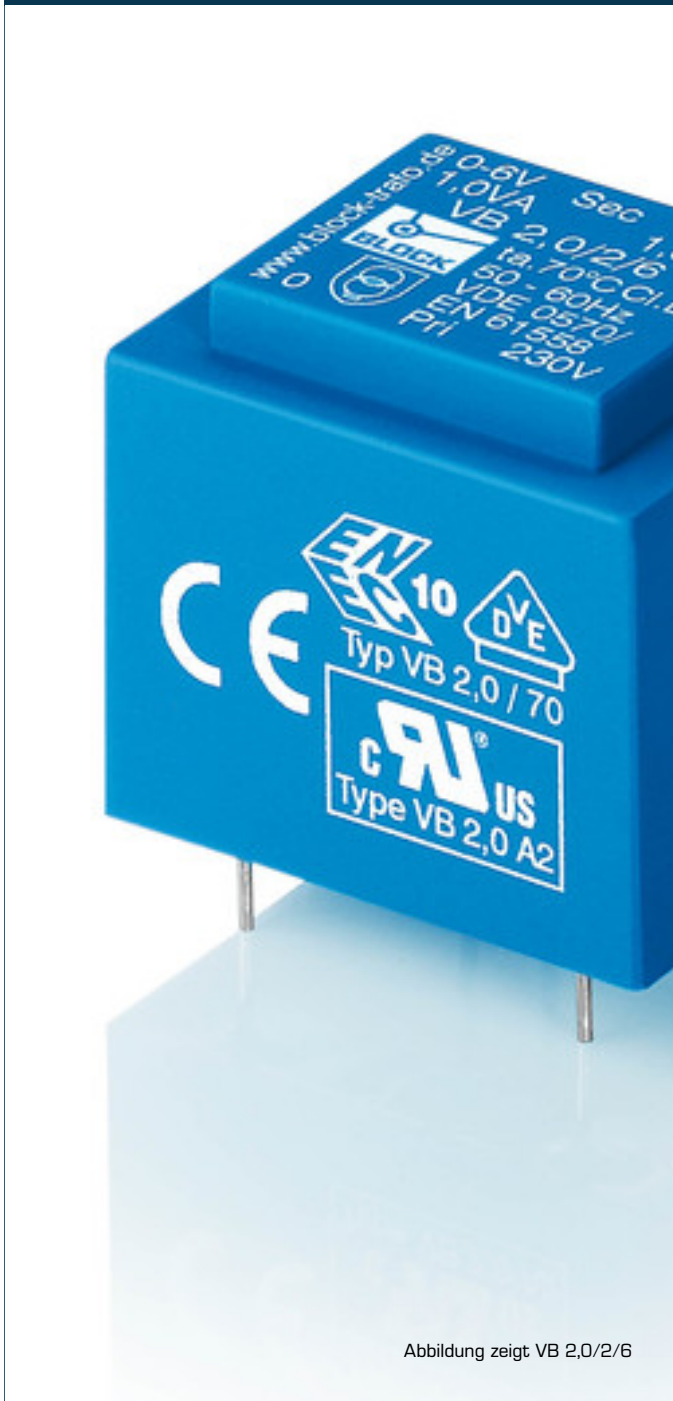
Abbildung zeigt VB 2,0/2/6