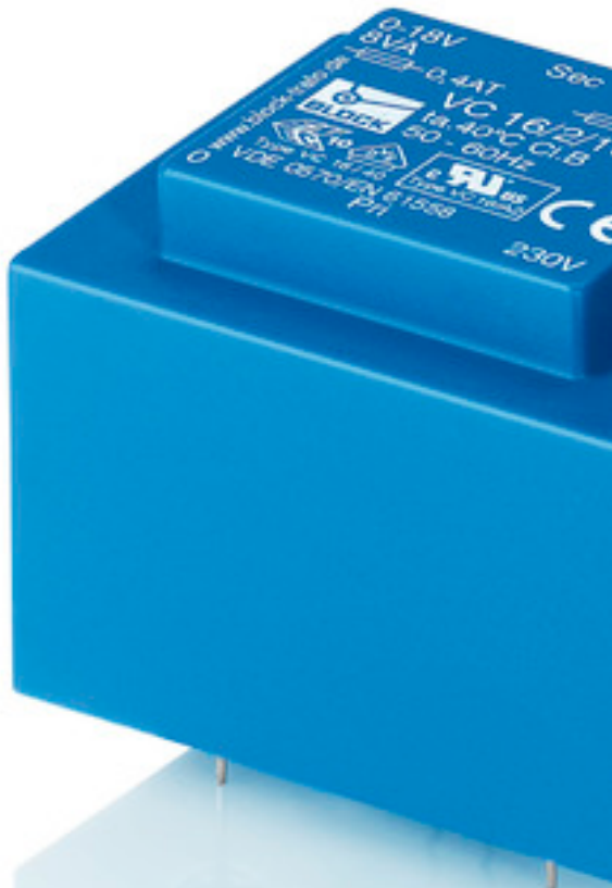
Abbildung zeigt VC 16/2/18