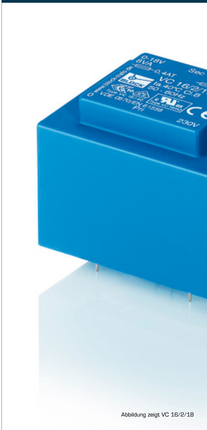
Abbildung zeigt VC 16/2/18