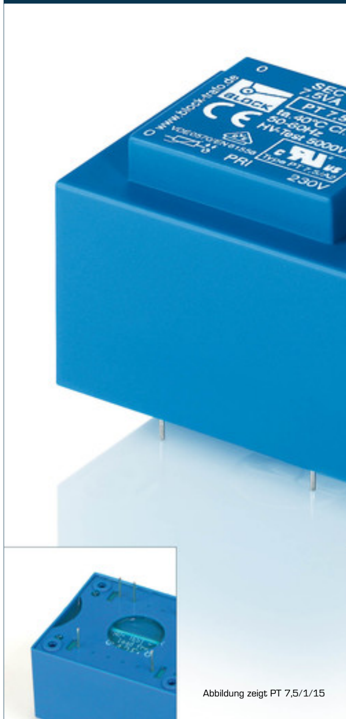
Abbildung zeigt PT 7,5/1/15