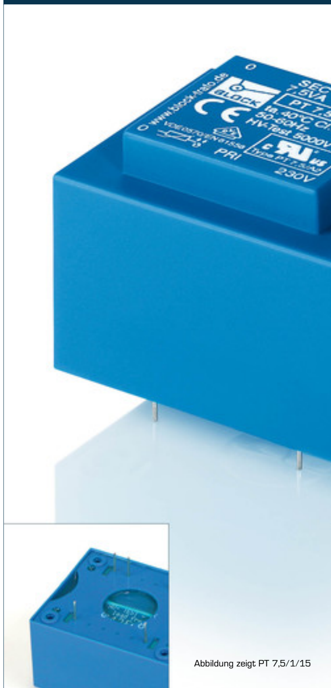
Abbildung zeigt PT 7,5/1/15