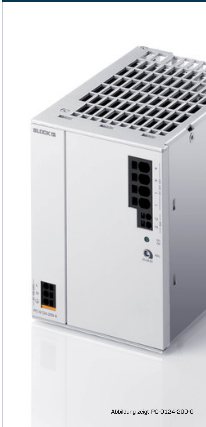
Abbildung zeigt PC-0124-200-0