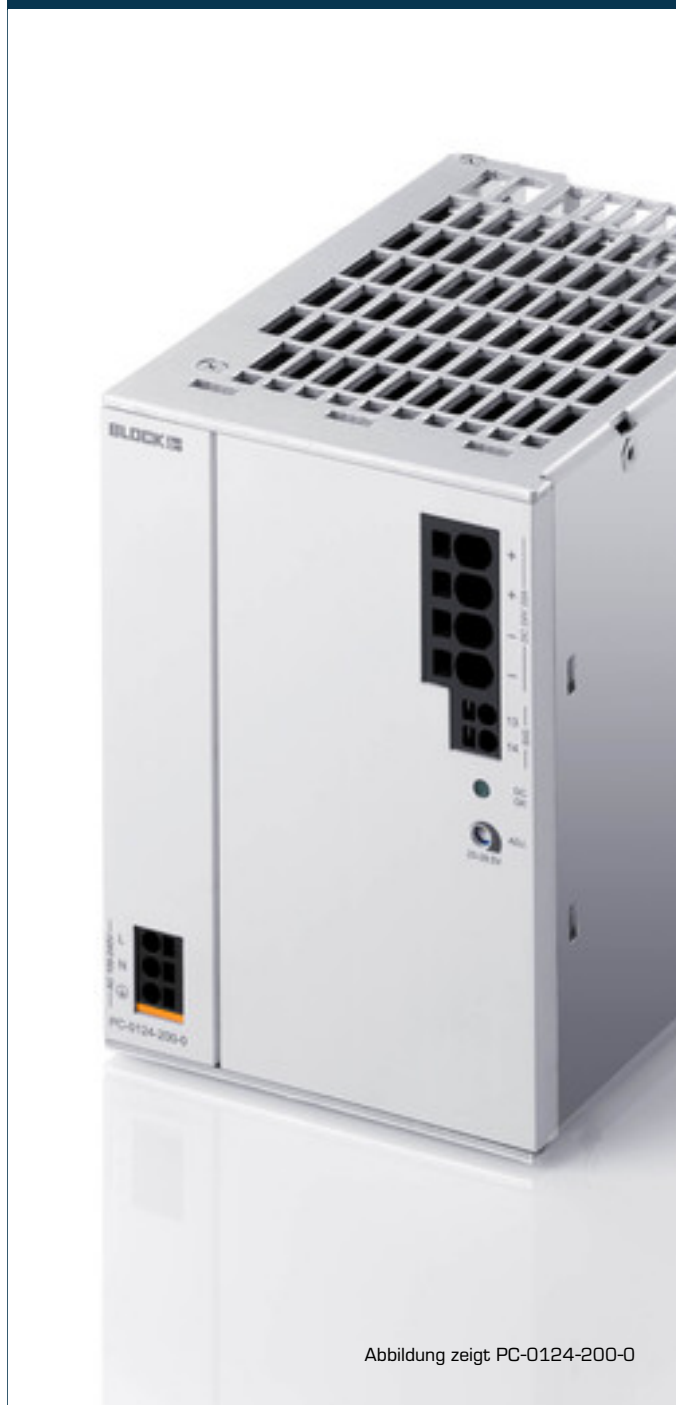
Abbildung zeigt PC-0124-200-0