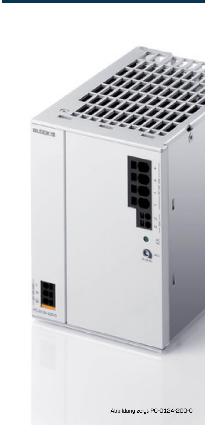
Abbildung zeigt PC-0124-200-0