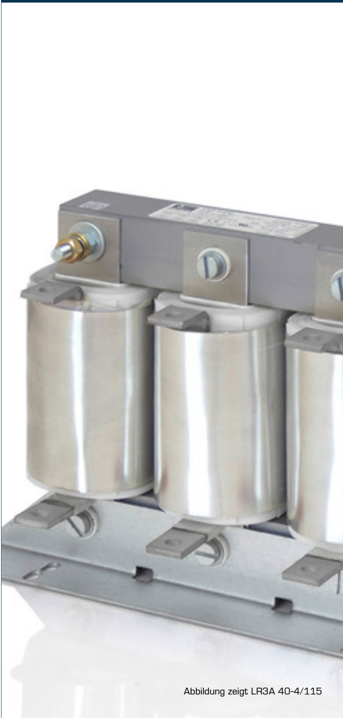
Abbildung zeigt LR3A 40-4/115