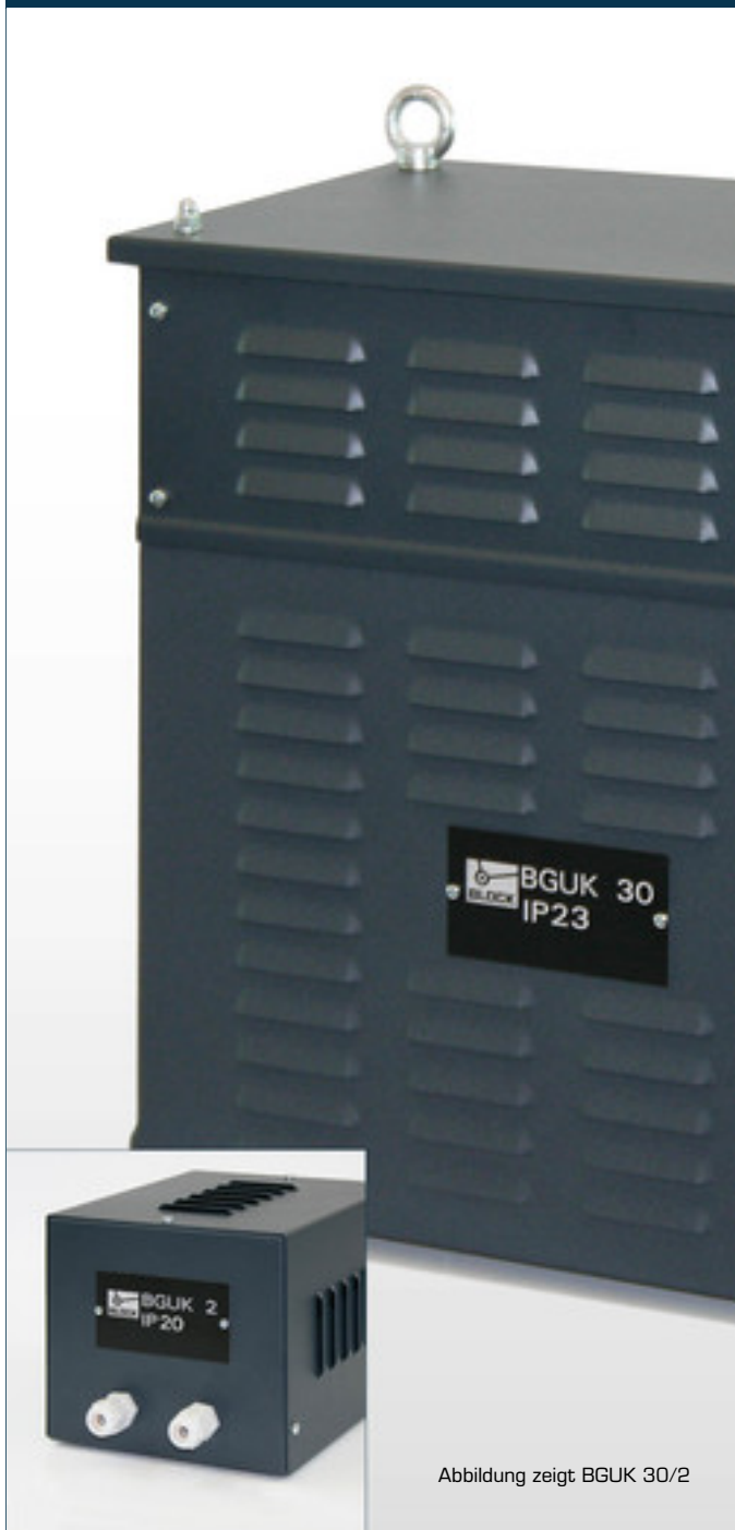
Abbildung zeigt BGUK 30/2