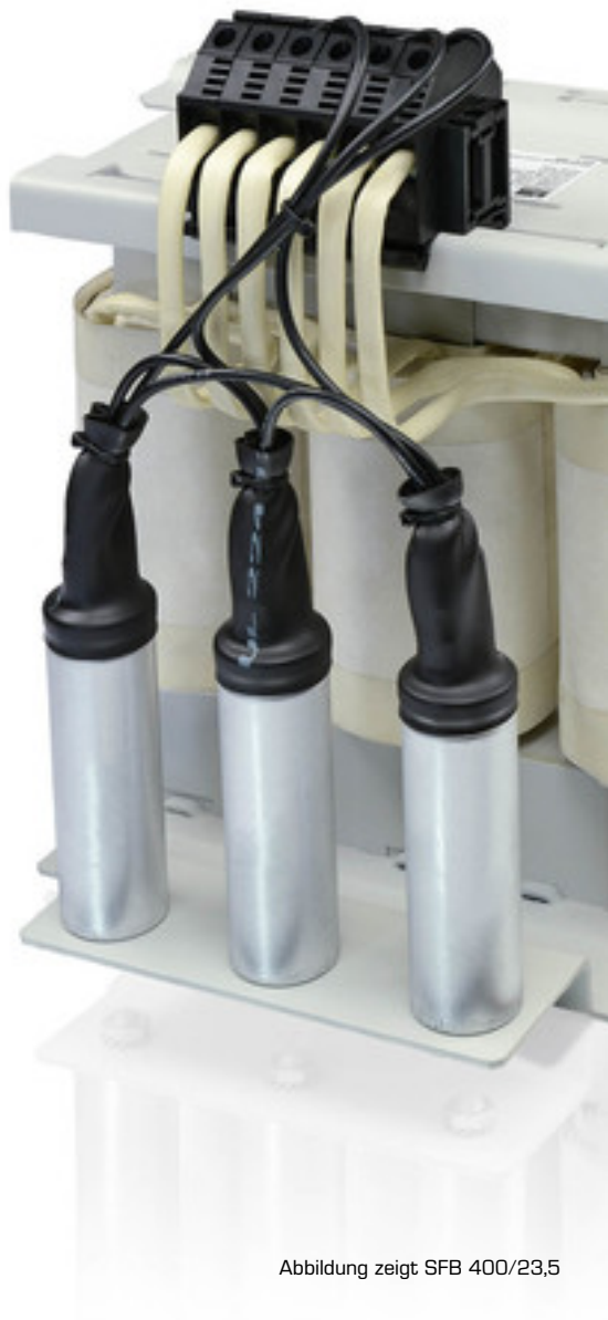
Abbildung zeigt SFB 400/23,5