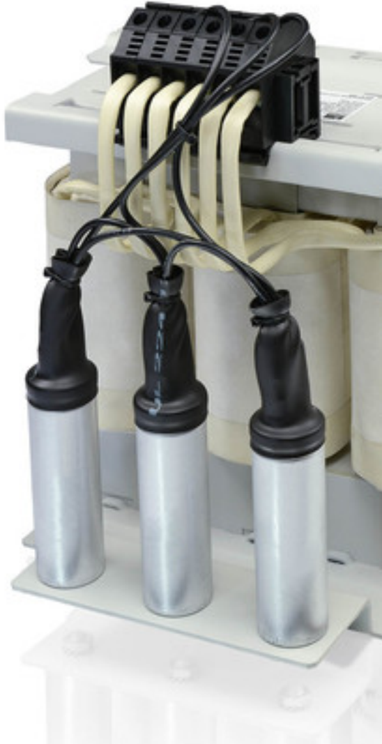
Abbildung zeigt SFB 400/23,5