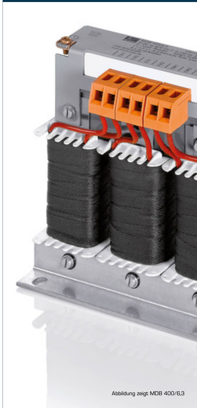
Abbildung zeigt MDB 400/6,3