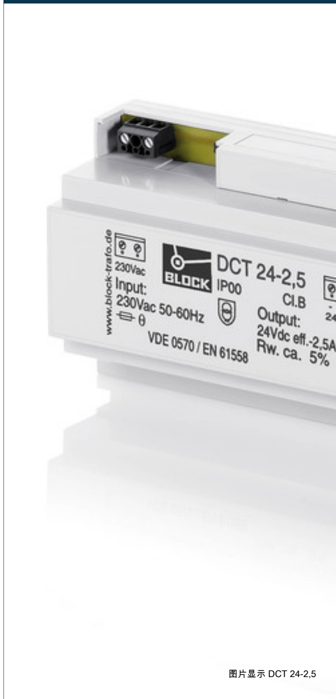
图片显示 DCT 24-2,5