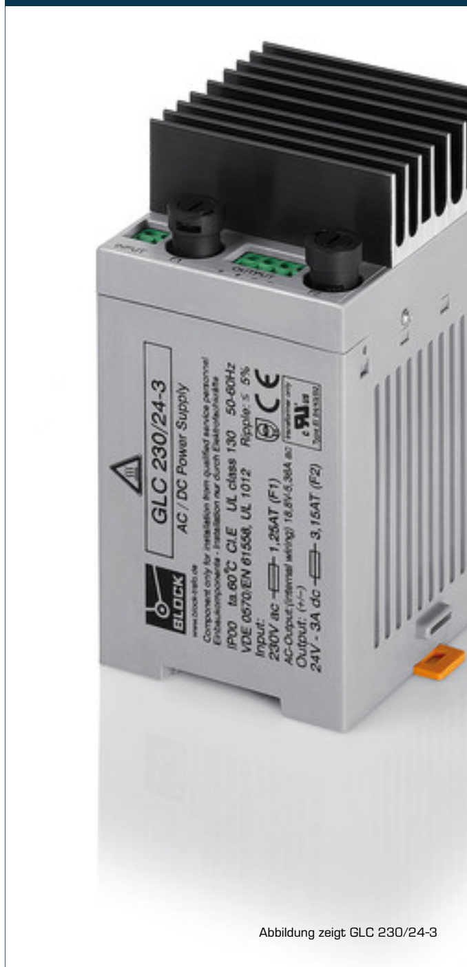
Abbildung zeigt GLC 230/24-3