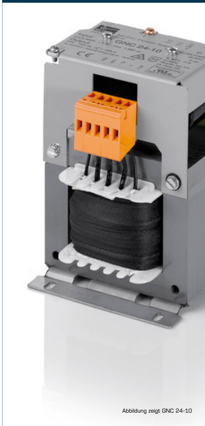
Abbildung zeigt GNC 24-10