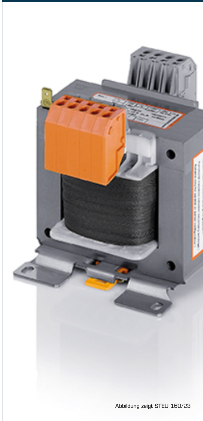
Abbildung zeigt STEU 160/23