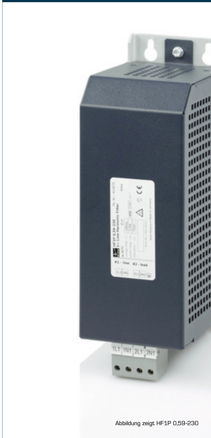
Abbildung zeigt HF1P 0,59-230