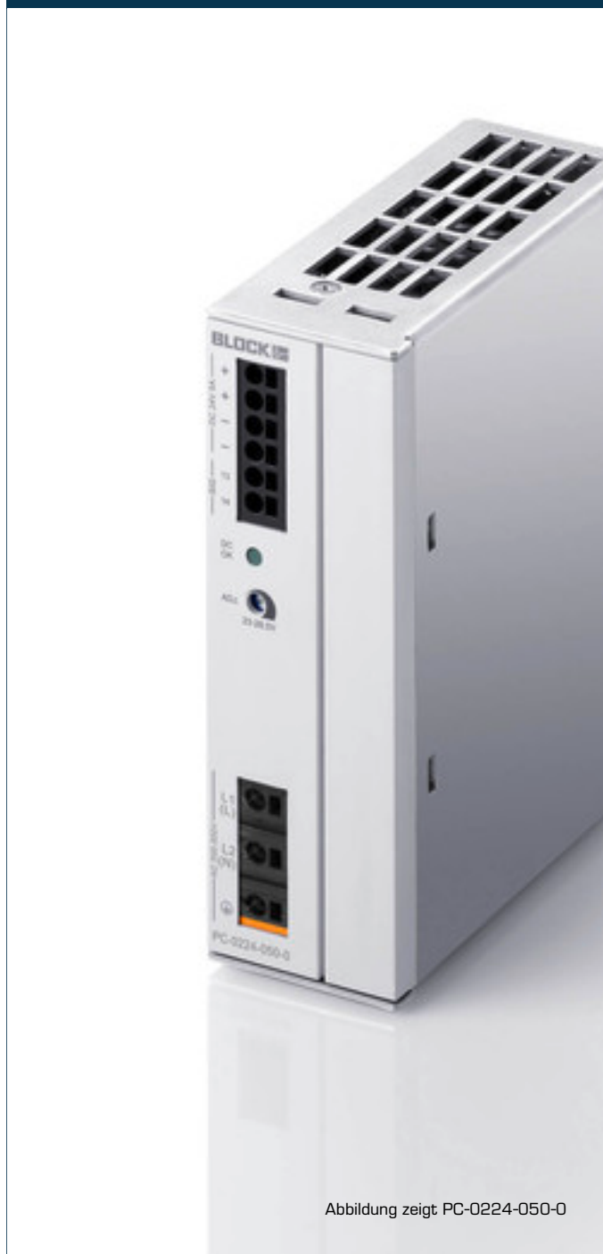
Abbildung zeigt PC-0224-050-0