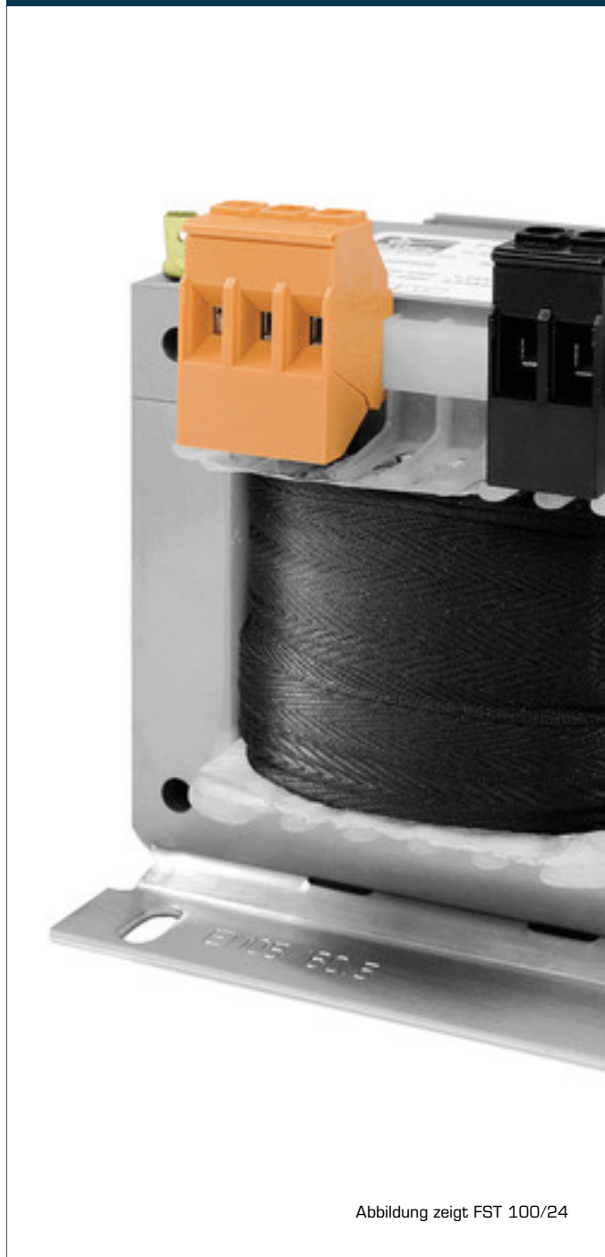
Abbildung zeigt FST 100/24