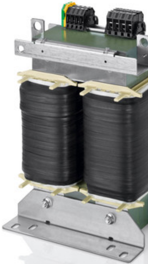
Abbildung zeigt TT1 20-4/23