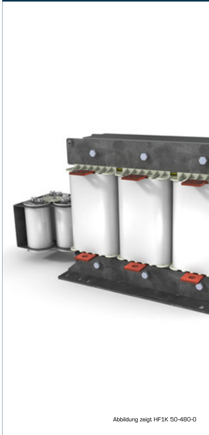
Abbildung zeigt HF1K 50-480-0