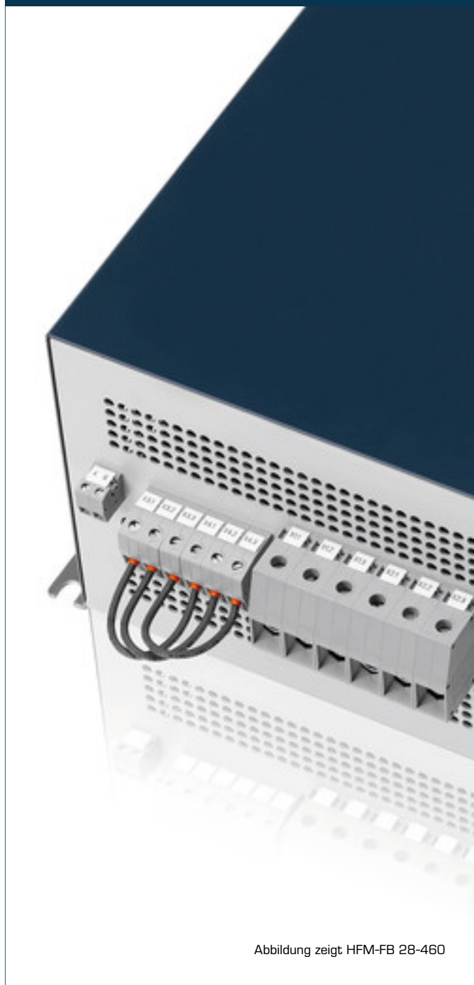
Abbildung zeigt HFM-FB 28-460