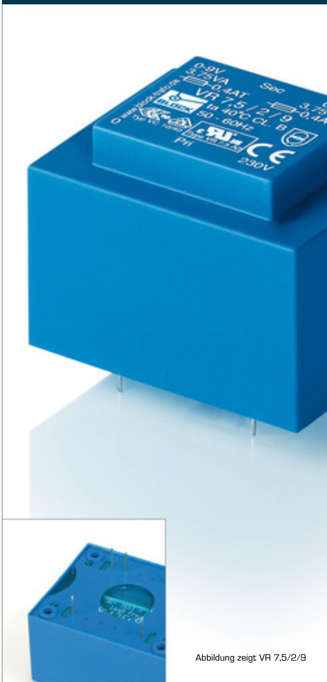
Abbildung zeigt VR 7,5/2/9