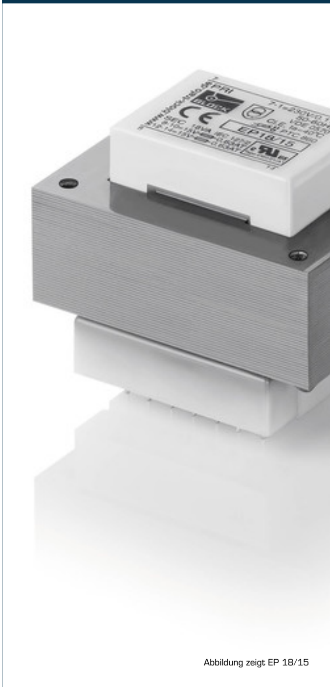
Abbildung zeigt EP 18/15