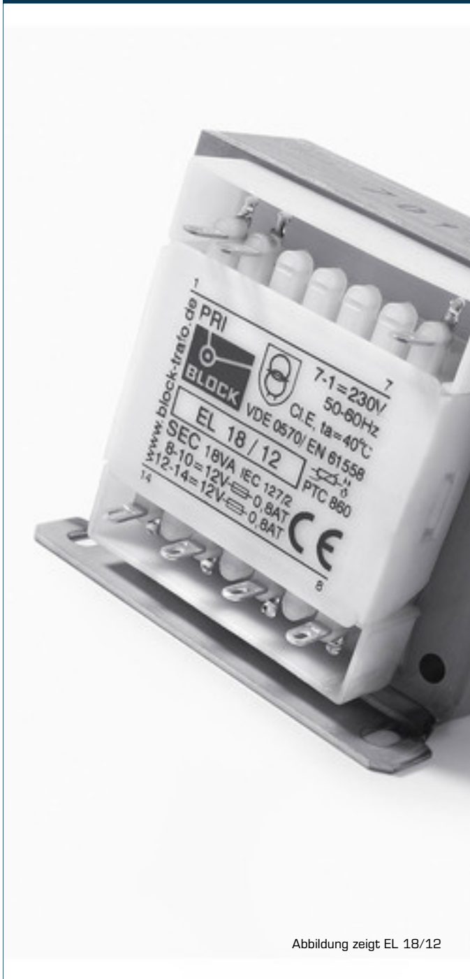
Abbildung zeigt EL 18/12