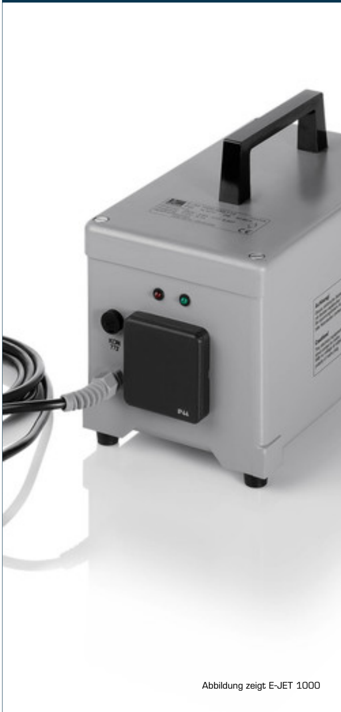
Abbildung zeigt E-JET 1000