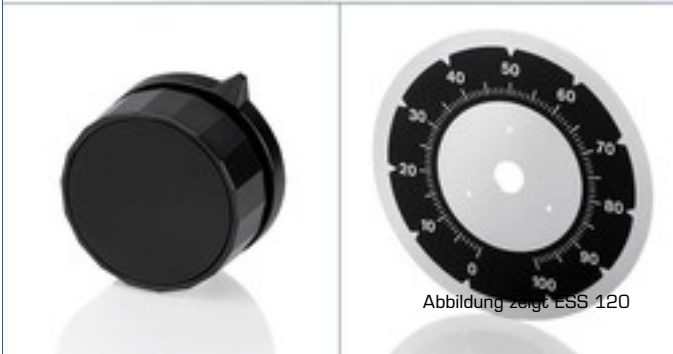
Abbildung zeigt ESS 120