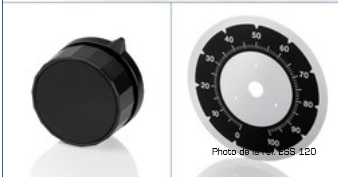
Photo de la ref. ESS 120