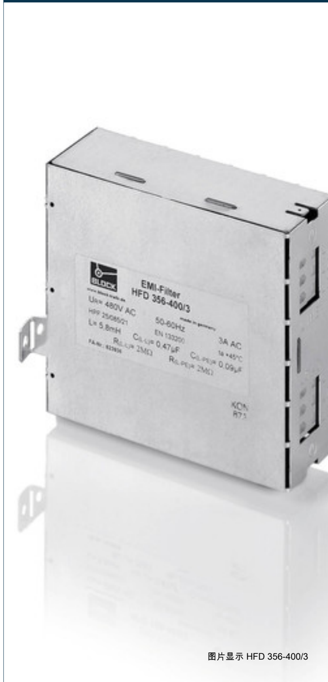
图片显示 HFD 356-400/3