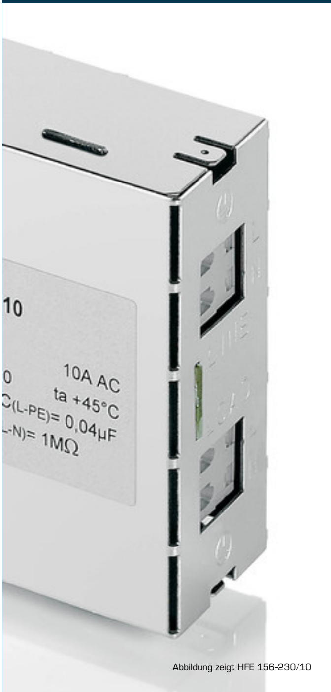
Abbildung zeigt HFE 156-230/10